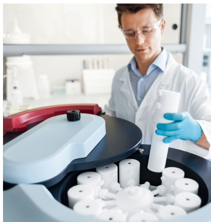
Minéralisation d'échantillons avec le Micro-ondes speedwave XPERT