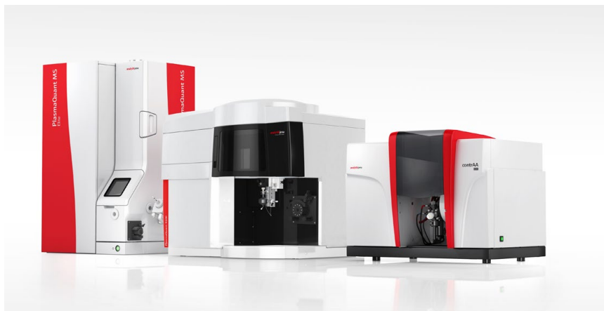
PlasmaQuant MS, PlasmaQuant 9100